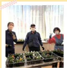
大切に育てた花苗をプレゼント！