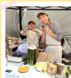
ロータリーにもお店がいっぱい！