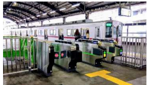
階段を上ると新しい自動改札がある。