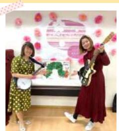
みんなで歌って春を満喫♪