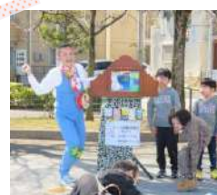
紙芝居、楽しかったね！