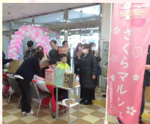
4回目となる開催。今年も大盛況でした！

参加企業・団体や来場されたみなさま、ありがとうございました。次回の開催もお楽しみに！