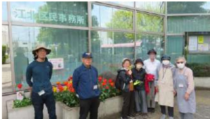
花壇ボランティアの皆さん