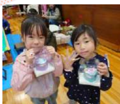
素敵な作品がっくれたね！