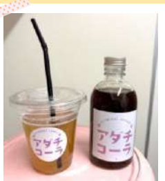
初お披露目のアダチコーラ