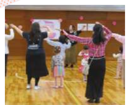
桜の曲でフラを踊ったよ♪