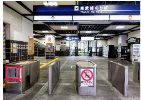
かつての改札の名残り

では、改札はどこにあるのでしょうか。実は大師前駅は、令和8年2月まで、東京23区内唯一の無改札駅でした。初めて利用したときは、乗車の仕方がわからずドキドキしたのを覚えています。現在はホーム階に新しい自動改札ができ、時代を越えて乗車するような不思議な感覚が味わえます。