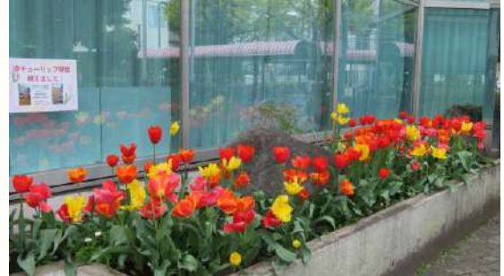
色鮮やかなチューリップ

4月9日(木)、江北センターのチューリップ花壇が、区の「花いっぱいコンクール」春の部の実地審査を受けました。天気にも恵まれ、満開となったチューリップは審査員からも好評で、同席した花壇ボランティアメンバーにも笑顔が見られました。これからもガーデニングサロンの活動を通して、花壇ボランティアや参加のみなさんと明るい花壇づくりをしていきます。