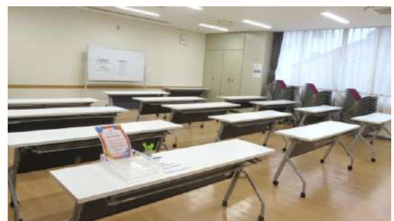
日により使える施設が異なります(写真は第一学習室)。