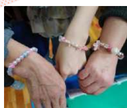
色とりどりの桜グレスレット