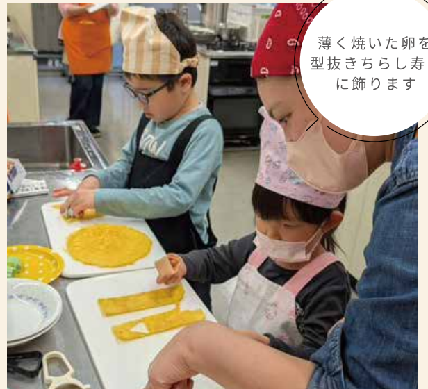
薄く焼いた卵を型抜きちらし寿司に飾ります

詳細はすまいる食堂の Instagram をご確認ください。新体制でさらにパワーアップしていくすまいる食堂を、これからもよろしくお願いいたします。