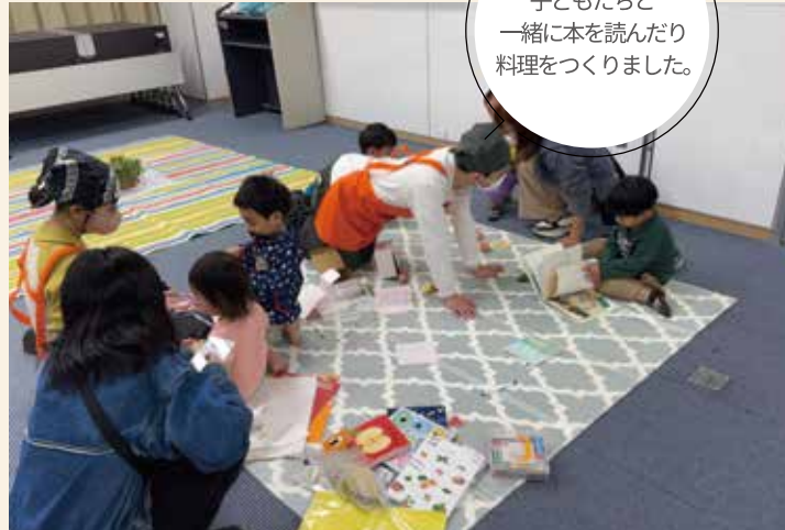
子どもたちと一緒に本を読んだり料理をつくりました。

調理補助と子どもたちの見守りと大活躍！子どもたちも優しいお兄さんお姉さんと遊べてニコニコ笑顔でとっても楽しそうでした。