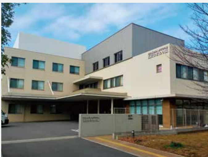
「江北ひまわり園」の様子

https://www.mofa.go.jp/mofaj/gaiko/oda/sdgs/about/