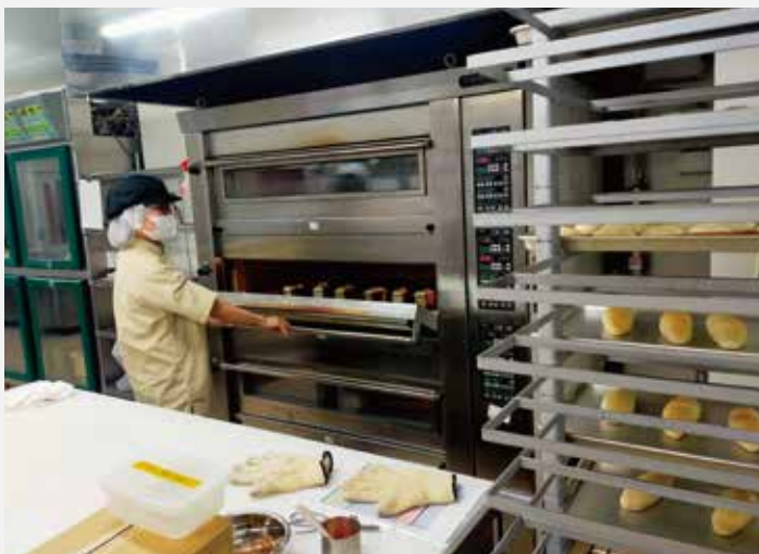
園内で作られたパン生地を焼く江北ひまわり園のスタッフ。