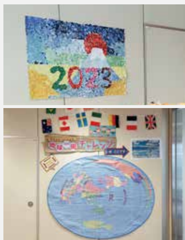
園内では利用者が楽しめる活動があります。左は貼り絵アート。右は散歩で歩いた距離を集計して世界地図に提示しています。

『パン、おいしかったよ』というお客様からの声を励みに、江北ひまわり園の挑戦は続きます。