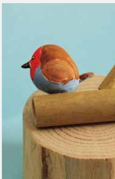
森のクラフト教室の作品「鳥笛」。

自然と触れ合いもつと足立の魅力を知りきっかけとして、森林インストラクターの教室に一度参加してみませんか？