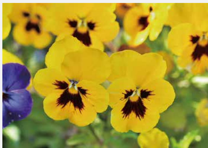
植物の由来を知ることで、現在の自然との共存、豊かさを学べます。

無為自然の風景は少なくなってしまった。ホームセンターで売っているパンジーなどの園芸植物、河川敷に咲いているセイヨウタンポポなどの外来植物、シンボルツリーの庭木や街路樹などの植栽植物といった、人の手が加わった植物の風景に変わりつつあります。だからと言って悲観しているだけではいけません。自然とは変化し掴みどころのないものです。現在にあるものも、また、広義の自然なのです。ただ、足立区の変わりゆく環境の中で、在来の植物が人と共存し生き延びていることもあり感動を覚えます。ぜひ観察会に参加して見てほしい。」と話してくれました。