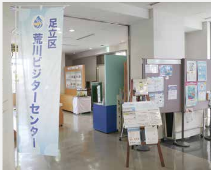
荒川ビジターセンター入り口。大きなのぼり旗が目印です。

自然解説員の皆さん。5名の経験豊富なスタッフが在籍しているので、荒川の自然や歴史についてぜひ聞いてみてください。センター直結の荒川河川敷にて撮影