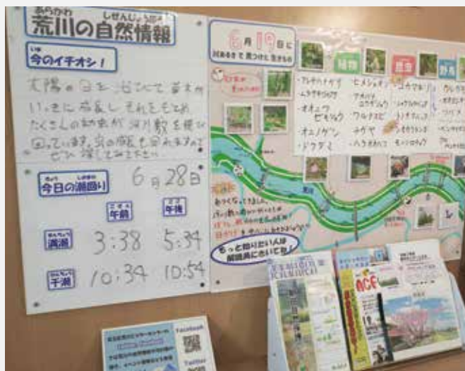
月2回の川歩きで見つけた植物や動物の情報も展示しています。

ビジターセンターは人と自然が仲良くなれるきっかけの場になりたいと考えています。これからも足立区や様々な市民活動団体と連携して取組んでいくことでSDGsに貢献していければと思います。」と話してくれました。