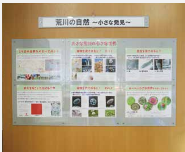
館内の展示の様子。荒川の自然についてわかりやすく学べます。

荒川で採集した生きものも展示していて、すぐ近くで観察できます。取材の日は写真のドジョウのほか、カメ、ウナギ、カニなどがいました。