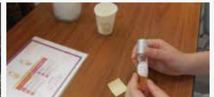
アロマづくり体験