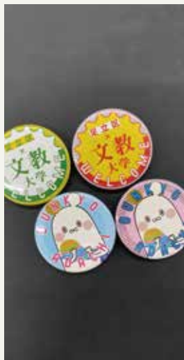
缶バッジ配布中です。

今回のリレー講座を記念して、文教大学の缶バッジを当センター窓口で配布しています。文教大学のマスクotteキャラクタIBUNKOはなんとも言えないかわいらしさがありますよね。ご希望の方は窓口でお申し出ください。