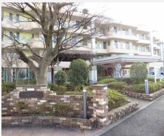
ハピネスあだちの施設外観。奥にホウカツ江北の事務所もある。

「特別養護老人ホーム ハピネスあだち」は、生活の中で食事や排泄など身の回りの介護が必要な高齢者を受け入れています。 特別養護老人ホーム（特養）では、在宅での生活が困難になった要介護の高齢者を受け入れ、食事・入浴などの介護や日常動作の訓練など、入居者の日常生活のお世話をしています。また、短期入所生活介護（ショートステイ）や日帰りで利用する通所介護（デイサービス）、ヘルパー派遣や福祉用具の紹介などの在宅介護の支援も行っており、それぞれの家族と利用者にあった介護を提供しています。