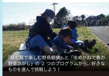
「目と耳で楽しむ野鳥観察」と「虫めがねで春の野草さがし」の2つのプログラムから、好きなものを選んで挑戦しよう！