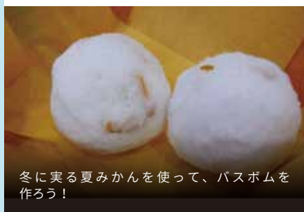
冬に実る夏みかんを使って、バスボムを作ろう！