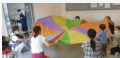
親子でハイアンリトミック