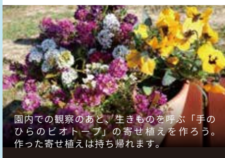
園内での観察のあと、生きものと呼ぶ「手のひらのビオトープ」の寄せ植えを作ろう。作った寄せ植えは持ち帰れます。