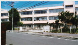
都立足立特別支援学校

現在、花畑七丁目の毛長川にて『大鷲さくら橋』の建設工事が進められております。掲示されている説明文によると、計画では橋の全長は二十四・九m、幅員が十六・八mで車道と歩道が分離され、歩行空間は誰もが安全・安心で快適に通行出来るバリアフリーの構造となっています。現在暫定的に上流側の歩道が開通しています。橋梁の名称ですが、花畑地区内にある大鷲神社と現在架かっている人道橋『さくらはし』に由来するもので、花畑一丁目から八丁目、南花畑五丁目にお住まいの方、区立小学校・中学校・都立特別支援学校に通う児童・生徒の皆さまから公募した五百通以上の応募作品の中から、『橋の名前選考会』の審査