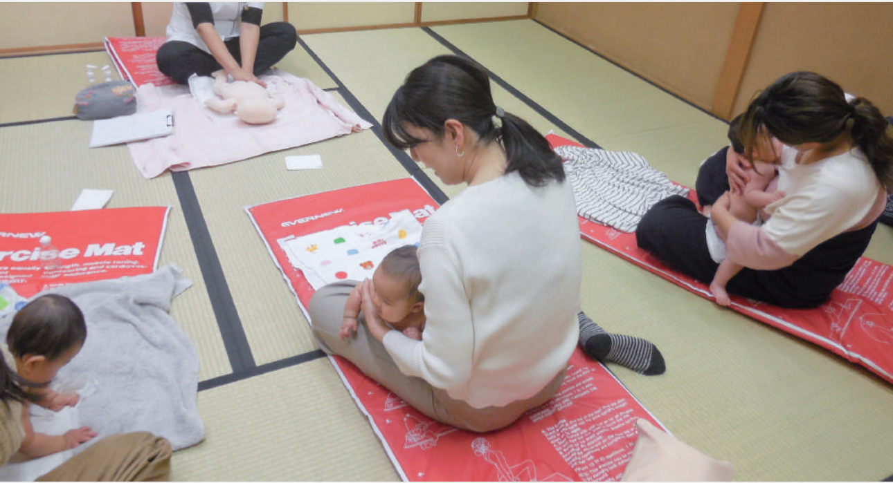
少人数制でゆったり受けられます