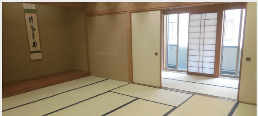
会場の教養室。換気をして消毒を徹底しています