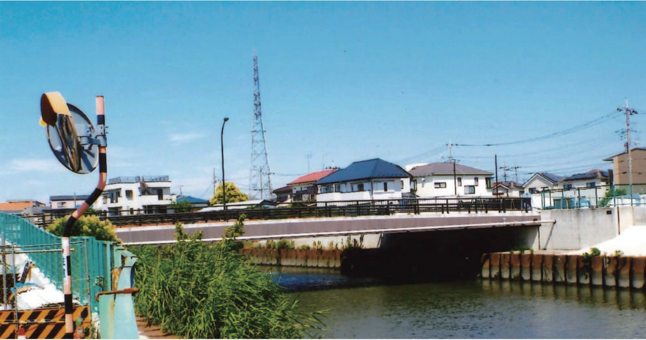
工事中の大鷲さくら橋