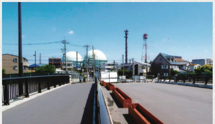
開通している上流側の歩道