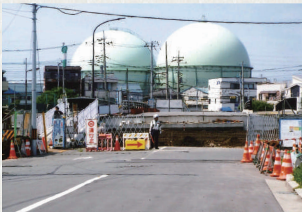
大鷲さくら橋と東京ガスのガスタンク

により、正式名称として選定されたとあります。かつて花畑から対岸の草加市へ行くには、上流の旧日光街道の水神橋か、下流の大鷲神社先の鷲宮橋を渡るしか無く、昭和五十八年四月、花畑五丁目に花畑大橋が開通するまでは、大変不便でした。大鷲さくら橋から発する『大鷲通り』は一直線に花畑地域を通り、花畑一丁目で『花畑フラワーロード』と交差し、南花畑四丁目で都道二〇二号線に合流しております。また大鷲さくら橋を渡った先の草加市瀬崎地域には、旧日光街道を経て東武線谷塚駅と桑袋大橋を結ぶ『記念体育館通り』が通り、正面には巨大な東京ガスのガスタンクが迎えてくれます。今年度末の完成を目指して建設の進む『令和の新しい橋・大鷲さくら橋』です。