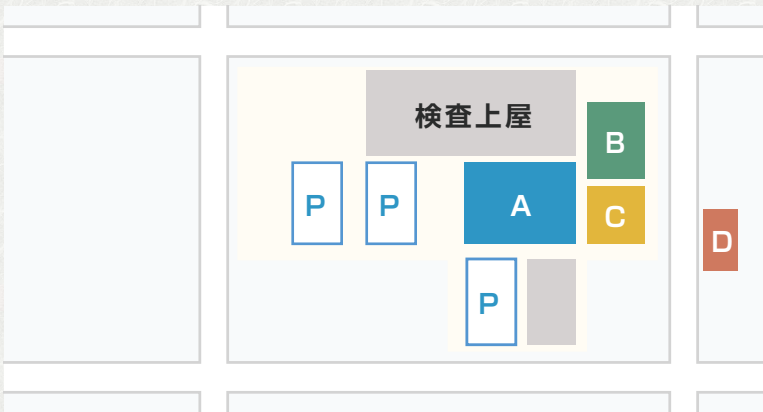
足立車検場の構内図

と表示されております。本庁舎の入り口の右側に大きな総合案内板が設置されており、検査・登録・二輪車等の各申請について、担当する庁舎及び各窓口での手続きの流れを詳しく紹介しております。自動車の検査作業は、独立行政法人自動車技術総合機構が本庁舎の右側にある検査上屋で行っております。現在足立車検場では、認証整備工場とインターネットで予約が出来るユーザー車検を含め一日に約五百台が検査に持ち込まれます。その他に保安基準適合証など必要な書類提出だけの事務手続きで済む、民間の指定整備工場での検査が千五百台の合計約二千台の車検が毎日行われております。常時絶え間なく大小の車両と登録手続きの人々がたくさん出入りし、活気溢れる足立車検場です。