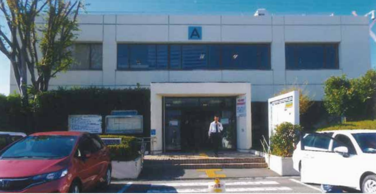
足立自動車登録事務所 本庁舎 A 棟