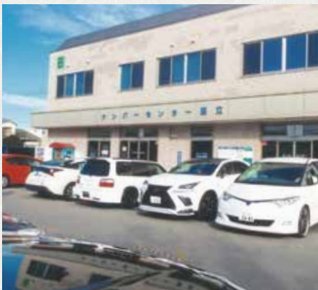
ナンバーセンター足立 B 棟