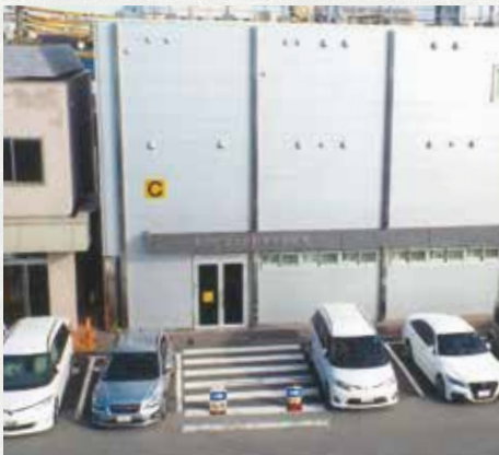
東京都足立自動車税事務所 C 棟

南花畑五丁目にあり、一般に足立車検場と呼ばれております『足立自動車検査登録事務所』ですが、一三、一七三mの敷地には検査を待つ広い駐車場の他に本庁舎を中心に四か所の庁舎があります。本庁舎の足立自動車検査登録事務所は(A)、申請書・印紙・ナンバーの販売や回収をするナンバーセンター足立が(B)、自動車税の全般を取り扱う東京都足立自動車税事務所が(C)と各建物に大きく表示されております。また車検場入り口前の道路の向こう側には軽二輪の受付・検査関係申請書重量税印紙などの販売を行う、社団法人自動車整備振興会の建物があり(D)