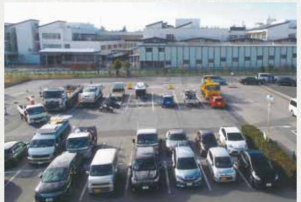
車検で待機する自動車