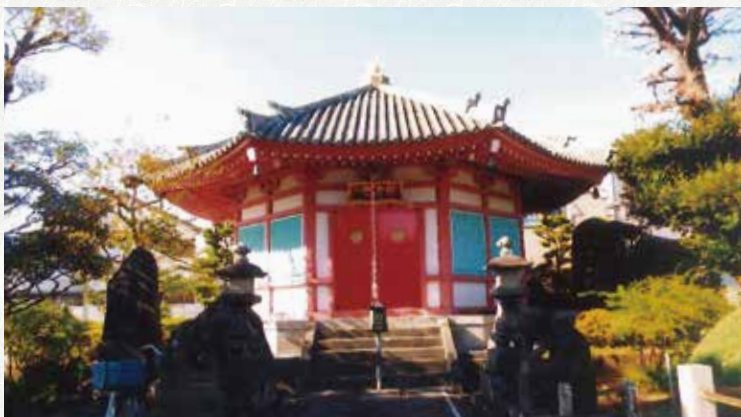
大般若経六百巻が納められている釈迦堂

境内の左側にある釈迦堂には、後三年の役（一〇八七年）で活躍した源氏の武将源義光が当寺に奉納した守り本尊と伝えられる、鷲に乗った釈迦如来像が安置されており、入り口の扉には当寺を庇護した源義光の子孫、秋田藩主・佐竹氏の家紋『扇に月丸』が掲げられております。また釈迦堂には大般若経六百巻が納められており、かつて四月八日にはお経を箱に入れて花畑村の若衆が担ぎ、村々を巡り厄払いと五穀豊穰を祈願する大般若会という行事が行われていました。現在では花まつりとして釈迦堂が開かれて護摩が焚かれ、源義光ゆかりの本尊一寸八分の鷲乗り釈迦如来像がご開帳されております。