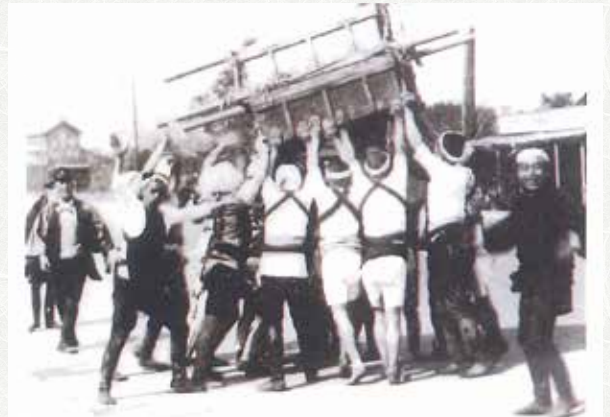
昭和15年(1940年)4月8日大般若巡行の様子