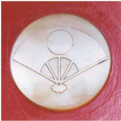
佐竹氏 家紋「扇に月丸」

花畑西小学校正門の前を通過して花畑大橋通りを渡り、花畑土地区画整理記念公園の先の花畑三丁目二十四番地に正覚院というお寺があります。足立風土記によると真言宗豊山派のお寺で鷲王山正覚院宝蔵寺と号し平安時代中期の創建です。山号からうかがえるように明治維新までは大鷲神社の別当でした。大鷲神社のご祭礼のときには当時の住職は必ず駕籠に乗って出かけたとあります。山門から本堂に向かう表参道には区の有形民俗文化財の庚申塔や供養塔が立ち並び、本堂前の右側には区の保存樹木で気根が無数に垂れ下がった『乳垂れ大イチョウ』と呼ばれるイチョウの巨木があり、お乳が欲しい人が真剣に願うと本当に乳が出るようになったと伝えられております。