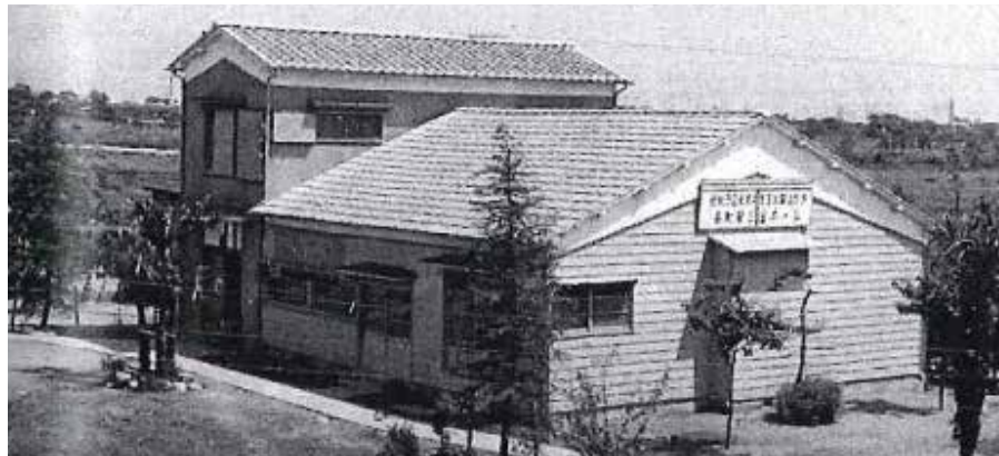
昭和33年9月、お年玉年賀はがき配付金120万円を受けて木造のホールが完成