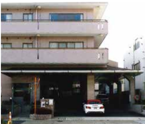
足立新生苑 正面玄関