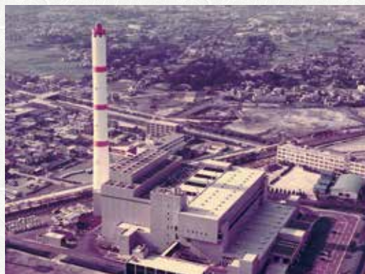
2 代目 昭和 52 年 9 月竣工