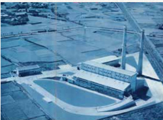
初代 昭和 39 年 2 月竣工

次回は私たちが生活する上で発生する『可燃ごみ』の焼却処理を行っている、足立清掃工場の活動についてご紹介致します。