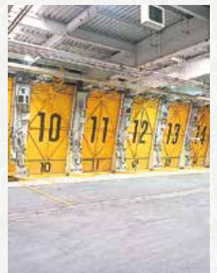
プラットフォーム